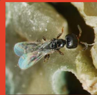
Figura 2. Adulto de la Avispa de Costa de Marfil dentro de un fruto brocado.